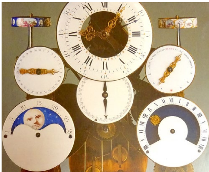
Mouvement d'une horloge astronomique de Bouchet correspondant avec celle décrit dans les Mémoires secrets pour servir à l'histoire de la République des Lettres en France , depuis 1762, jusqu'à nos jours.