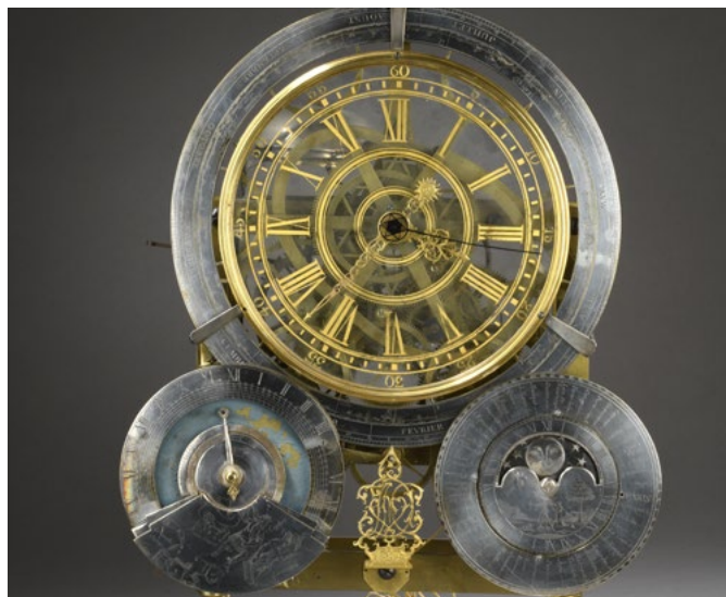
Notre Pendule astronomique montrant l'heure solaire et l'heure moyenne, à sonnerie des quarts et mouvement squelette.

La comparaison de certaines parties similaires à celles d'une autre pendule astronomique signée par Jean Louis Bouchet permet de lui attribuer celle-ci.