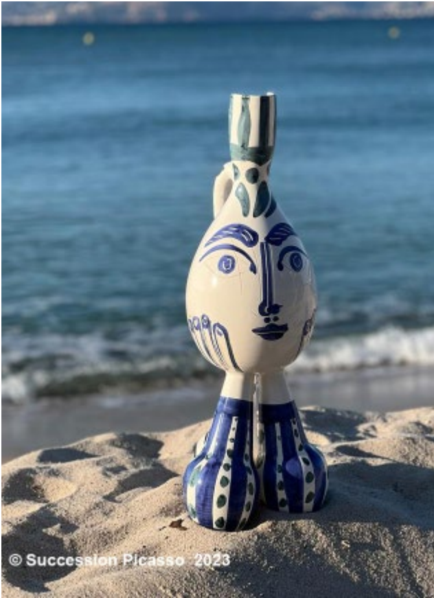
Pablo PICASSO (1881-1973) et Atelier MADOURA Vase tripode , 1951 Céramique émaillée Signé du cachet et numéroté 72/75 H. 75,5 cm 100.000 / 150.000 €