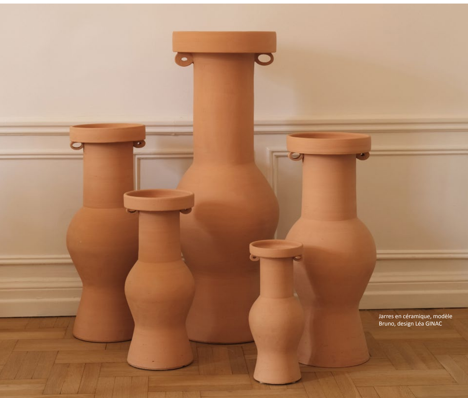
Jarres en céramique, modèle Bruno, design Léa GINAC