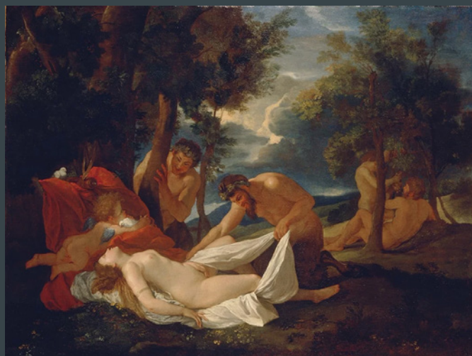
Nicolas Poussin (1594-1665), Vénus épiée par deux satyres , vers 1626, huile sur toile, Kunsthaus, Zurich.