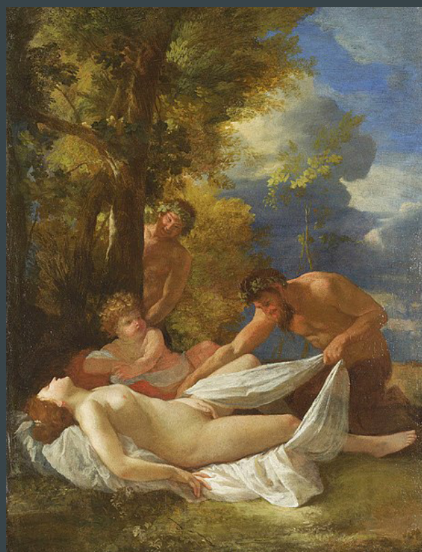
Nicolas Poussin (1594-1665), Vénus épiée par deux satyres , vers 1626 The National Gallery, Londres.